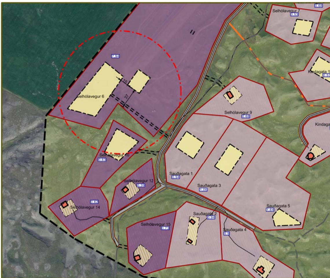
Tillaga að breytingu á deiliskipulagi í mars 2024. Mkv. 1:2000