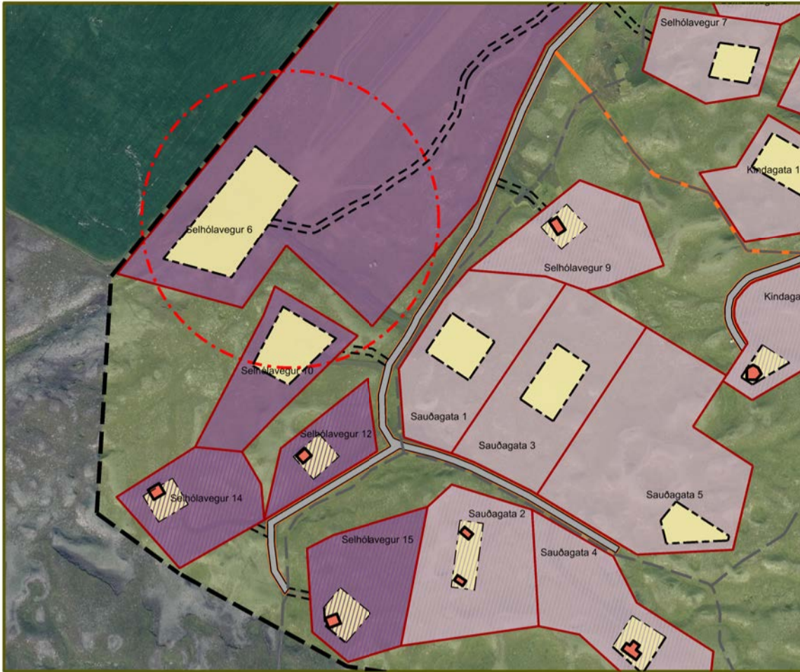
Gildandi deiliskipulag frá 2016 með seinni breytingum, Mkv. 1:2000