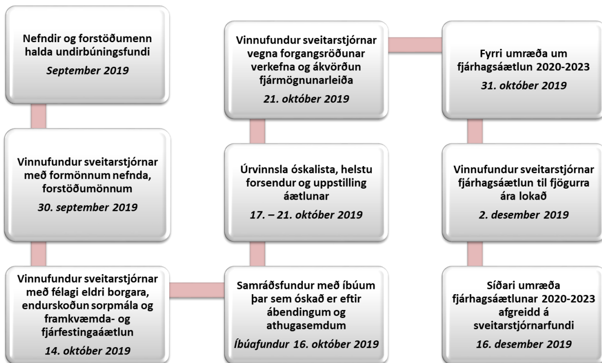
Mynd 1 Verkfæri sveitarstjórnar við undirbúning fjárhagsáætlunar

Undirbúningur vegna fjárhagsáætlunar 2020-2023 hefur staðið yfir frá því í september. Sveitarstjórn hefur komið sér upp ákveðnu verklagi við fjárhagsáætlanagerðina í þeim tilgangi að fá sem flesta til þátttöku og gefa öllum tækifæri á að koma með ábendingar og athugasemdir í ferlinu. Fyrir utan aðkomu nefnda og forstöðumanna kallar sveitarstjórn til fulltrúa eldri borgara og ungmennaráðs ásamt því að boða til íbúafundar. Þátttaka samfélagsins í gerð fjárhagsáætlunar er mikilvæg þar sem niðurstaða hennar er bindandi fyrir sveitarstjórn þegar kemur að rekstri sveitarfélagsins á næsta ári og er ekki breytt nema með gerð viðauka við fjárhagsáætlun. Áætlunin sem gerð er fyrir 2021-2023 er síðan stefnumótandi áætlun sveitarstjórnar.